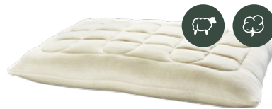
Kissenhülle Schafschurwolle Trikot