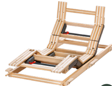
Einlegerahmen mit 4 Motoren