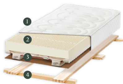
«Designa» Für den Boxspring-Look