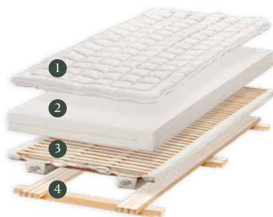
«Original» Besonders pflegeleicht