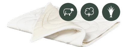
«DeLuxe» & «Designa» Schafschurwolle oder Baumwolle-Leinen