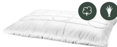
Kissenhülle Baumwolle-Leinen Satin