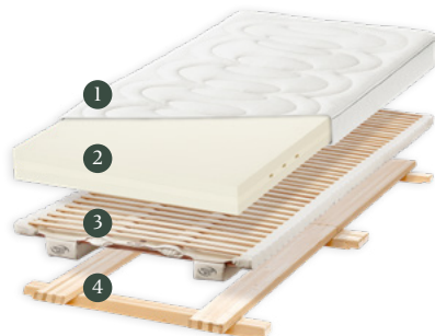
«DeLuxe» Perfektes Aussehen