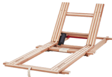
Einlegerahmen mit 1 Motor