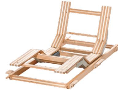
Einlegerahmen mit 2 Motoren Plus