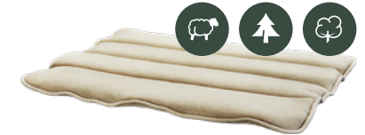
Füllung Schafschurwolle Arve/Zirbe