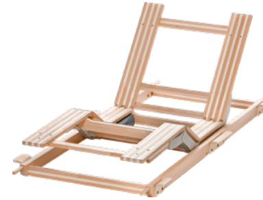
Einlegerahmen mit 2 Motoren