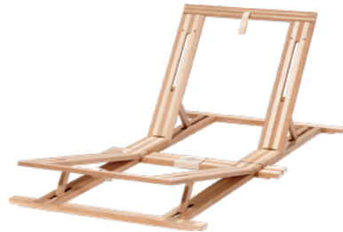
Einlegerahmen mit Sitzhochstellung oder Sitz- und Beinhochstellung